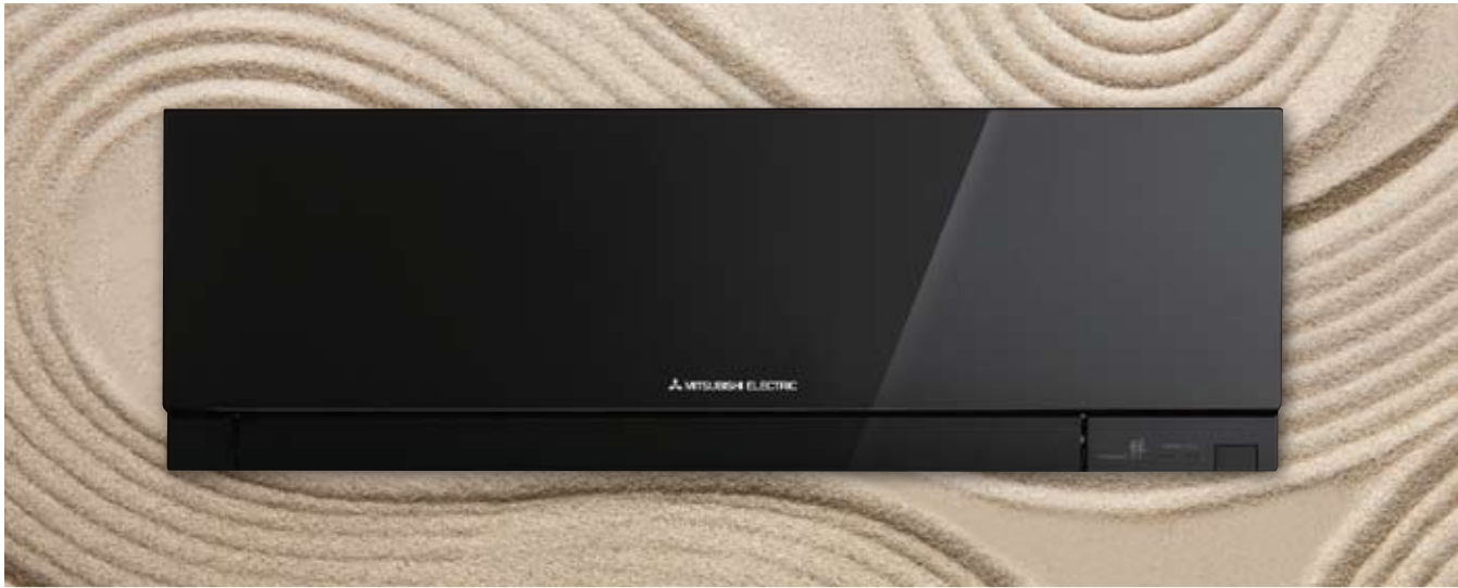
MSZ-EF VE2(W/B/S) - Kirigamine Zen

A Kirigamine Zen foi criada para proporcionar climatização de vanguarda e para ser um verdadeiro complemento decorativo de qualquer ambiente interior moderno.