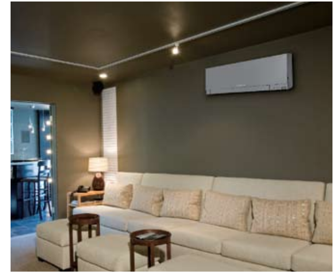
Modelo Mural Inverter

A unidade interior Kirigamine Zen mantém inalterado o seu perfil fino e elegante, mesmo durante o seu funcionamento. A única alteração a assinalar é o movimento do deflector de saída do ar. Tal resulta num visual permanentemente atractivo e sofisticado.